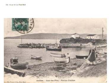
Port-abri du Crouton .