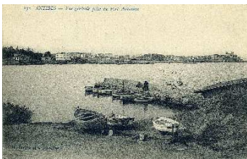
Port Auberon , (une promenade)