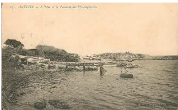
Port Nicolet , (une promenade) c'est à cet endroit que Paul ARENE a écrit – Le canot des 6 capitaines - 1876.