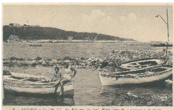
Abri de la Garoupe (une plage).

Malgré la crise, à ce jour, nos adhérents (136) nous sont restés fidèles. Cotisation = 6 042€.