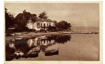
Abri de l' Olivette