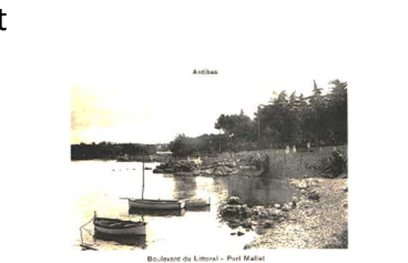
Port-abri Mallet (Abandonné).