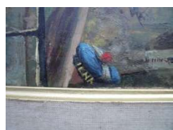
Bâchi de marin