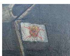
Drapeau de l'armateur