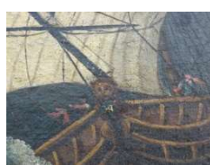
Tête de lion